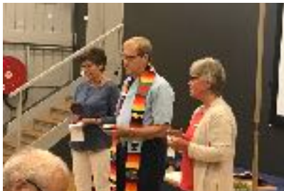
Morgonmessa, sommarmöte 2019