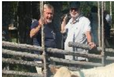
Utflykt till fåbod, sommarmöte 2019