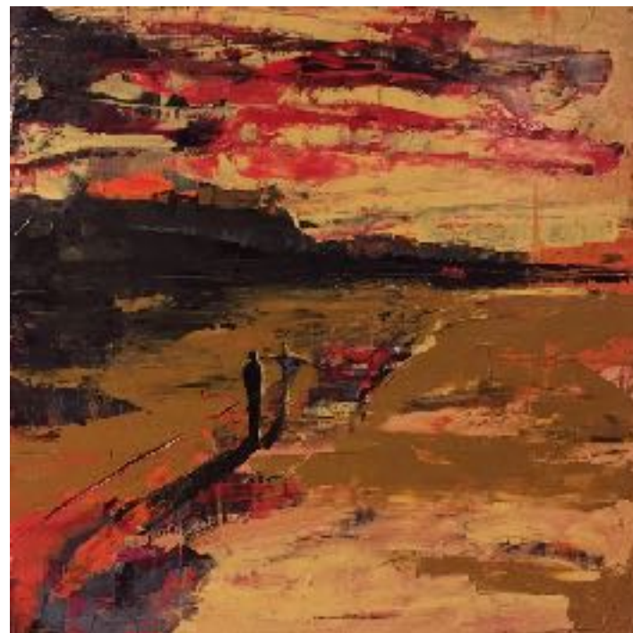
"Hemkomst". Målning av Kent Wisti.

Tro, hopp och framtid – att vara kristen i en galen tid