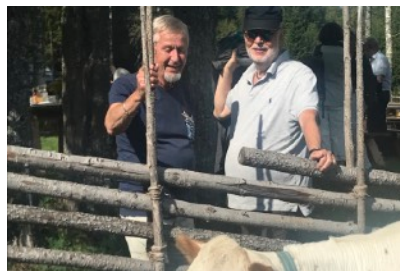
Utflykt till fåbod, sommarmöte 2019