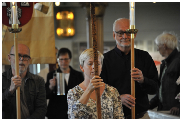
Gudstjänst, Växjö domkyrka, Sommarmöte 2016

Barn och ungdomar välkomnas varmt till sommarmötet. Vi ordnar ett speciellt program för dem under förmiddagarna. Alla under 18 år deltar i sommarmötet utan kostnad.