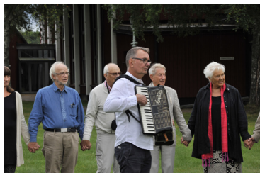
Festkväll, Sommarmötet 2016