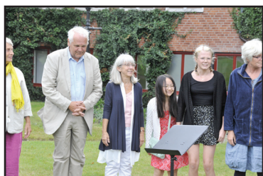
Festkväll, Sommarmötet 2017

Barn är varmt välkomna till sommarmötet. Johan och Johanna Garde ordnar lek och aktiviteter för barnen. Alla under 18 år deltar i sommarmötet utan kostnad.