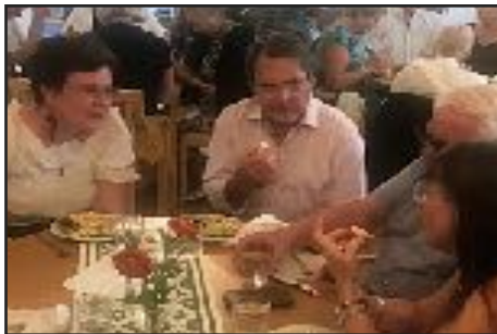
Från lördagens fest vid sommarmötet 2022

Barn och unga t.o.m.18 år deltar i sommarmötet utan kostnad. Vid behov ordnar vi barnvakt i samråd med föräldrarna.